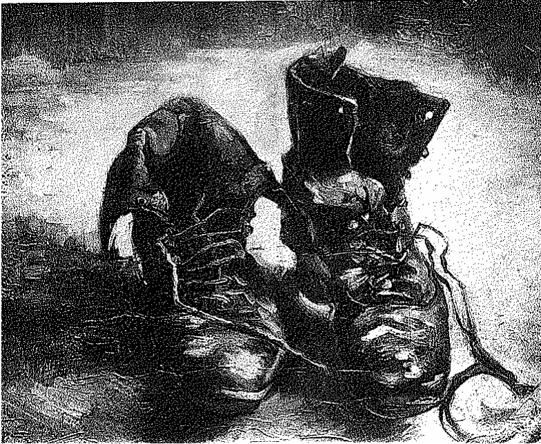
Billede nr. 255

- Hvorfor er det så klart? Der var andre Van Gogh-billeder på den pågældende udstilling. Også af sko.