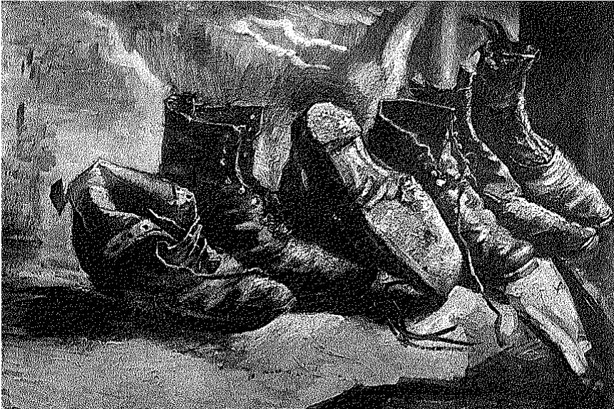
Billede nr. 332