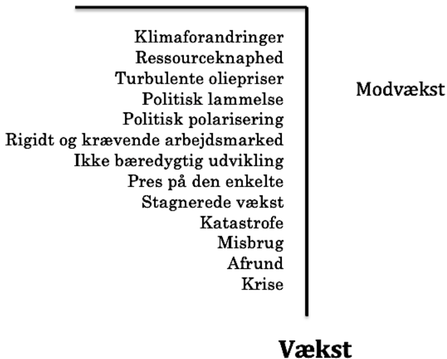
Figur 3: Illustration af eksempler på iagttagelsen af vækst som et begreb og hvordan iagttagelsen heraf definerer modbegrebet modvækst.

Den iagttagede forskel skaber en forståelse af, at modvækst netop ikke er katastrofal, formålsløs og ubæredygtig, men derimod er noget, der netop ikke medfører en uretfærdig udvikling, klimaforandringer, klimaflygtninge, mangel på ressourcer, krige, et rigidt og krævende arbejdsmarked og høj husleje. Derved er vækstkritikken beskrivende for, hvordan bevægelsen iagttager modvækst, da det er det modsatte af, hvad vækst kritiseres for at være.