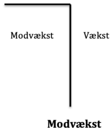
Figur 2: Illustration af en iagttagelse af modvækst som begreb og hvordan forskellen mellem begreb og modbegreb definerer begrebet.

Én måde at iagttage verden på, er ved at iagttage forskellen mellem begrebet og modbegrebet (Andersen, 1999:110). Begreber og modbegreber kan i høj grad karakteriseres gennem hinandens forskelle (ibid.) Modvækst er netop ikke vækst, og derfor kan man ved at kigge på dets modbegreb og erkende at det alt andet, tilegne sig en forståelse af hvad modvækst er,. Som modsætninger sætter begreb og modbegrebet på den måde restriktioner for hinanden ved at være forskellige fra hinanden.